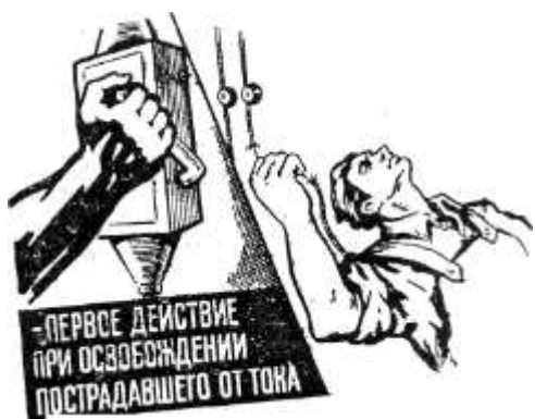
Рис. 1. Освобождение пострадавшего от действия электротока путем отключения электроустановки

БЫСТРОЕ ОТКЛЮЧЕНИЕ от действия электрического тока это Первое действие для спасения пострадавшего.