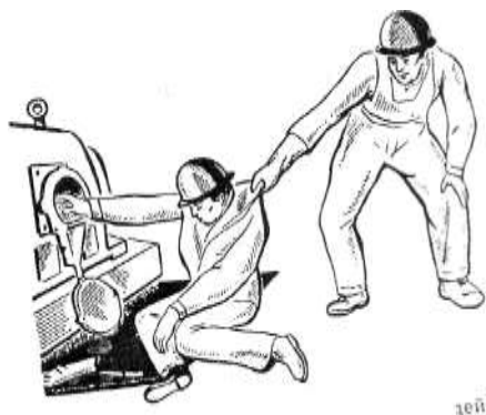
Рис. 3. Освобождение пострадавшего от действия токоведущей части, находящейся под напряжением до 1000 В