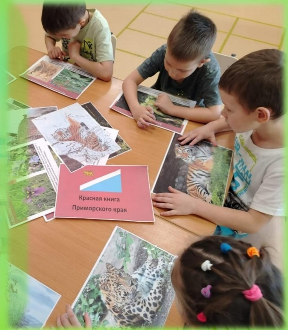
Мы знаем этих животных